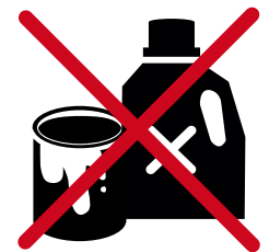
SOUDE, ALCCOL, COLLE, PEINTURE, ENGRAIS ...