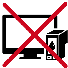
ÉQUIPEMENTS HIGH-TECH, CARTOUCHES D'ENCRE