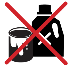
SOUDE, ALCCOL, COLLE, PEINTURE, ENGRAIS ...