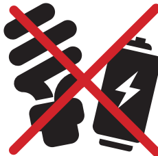
AMPOULES, NÉONS, PILES