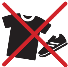
TEXTILE, CHAUSSURES, LINGE DE MAISON