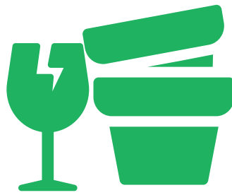
VAISSELLE, MIROIRS, VITRES, POTS DE FLEURS, ...