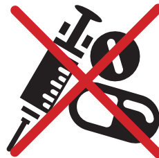
SERINGUES, AIGUILLES, MÉDICAMENTS