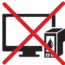
ÉQUIPMENTS HIGH-TECH, CARTOUCHES D'ENCRE